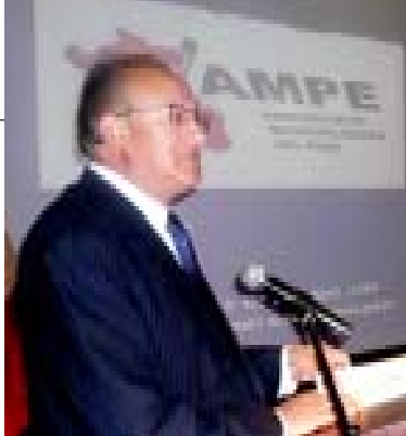
Alcalde de Cajamarca, Marco Aurelio La Torre.