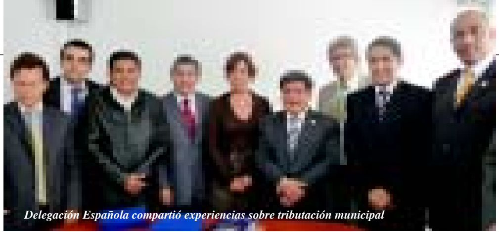
Delegación Española compartió experiencias sobre tributación municipal