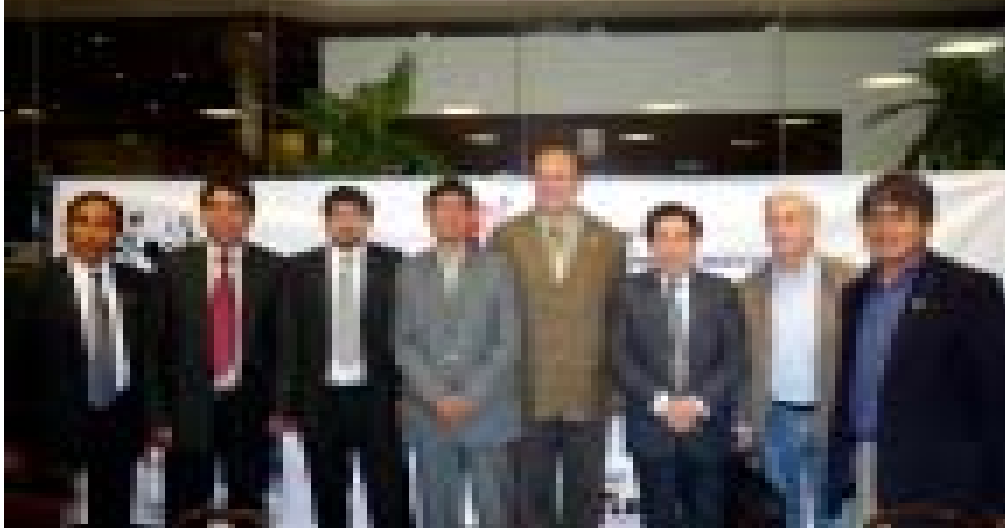
Encuentro de autoridades municipales de Zonas Mineras y VIII Desayuno Taller realizado por la AMPE.