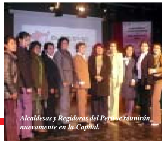
Alcaldesas y Regidoras del Perú se reunirán nuevamente en la Capital.

Un día antes, el 27 de noviembre, se realizará el II Encuentro Nacional de Alcaldesas y Regidoras del Perú.