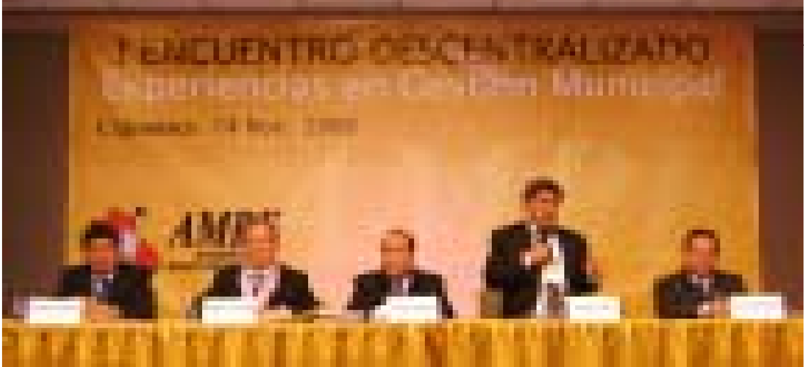
Sesión descentralizada del CEN de la AMPE realizada en la ciudad de Cajamarca.