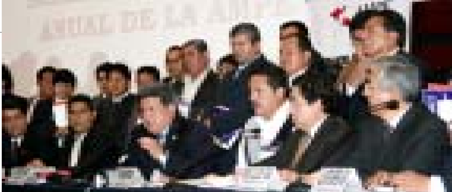
I Asamblea Nacional de Municipalidades realizada en junio, a la que asistieron cientos de alcaldes y que lideró el presidente de la AMPE César Acuña.

EN II Asamblea Nacional de Municipalidades