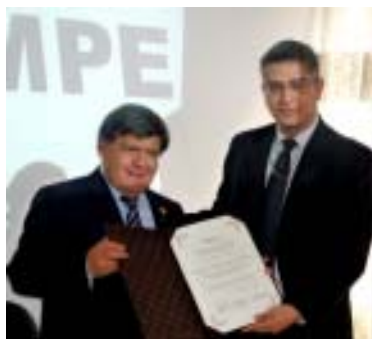
Presidente de AMPE, César Acuña recibe reconocimiento del INICAM

para engrosar los programas sociales del gobierno nacional.