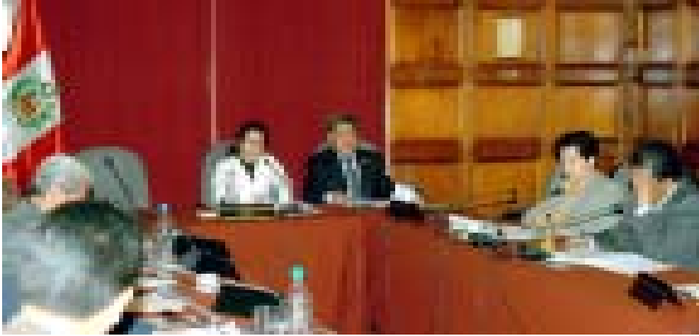
César Acuña, Alcalde de Trujillo y Presidente de AMPE sustentó ante la Comisión de Descentralización del Congreso ocho Proyectos de Ley de los Gobiernos Locales.