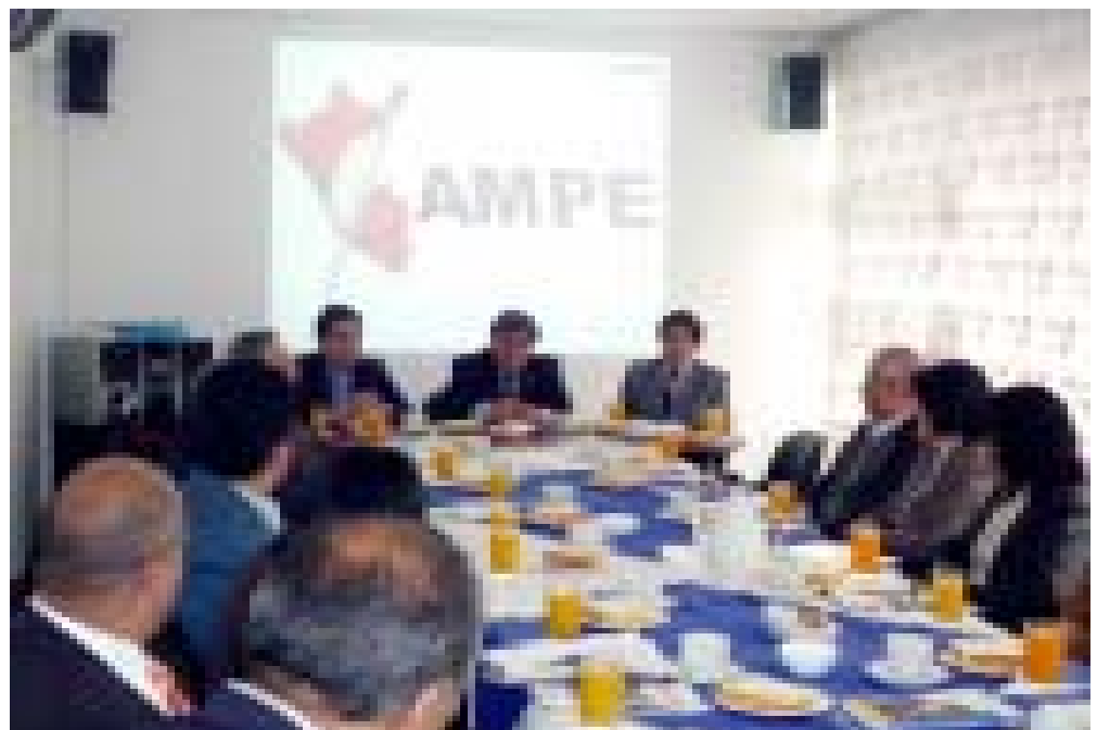
VII Desayuno Taller realizado por la AMPE