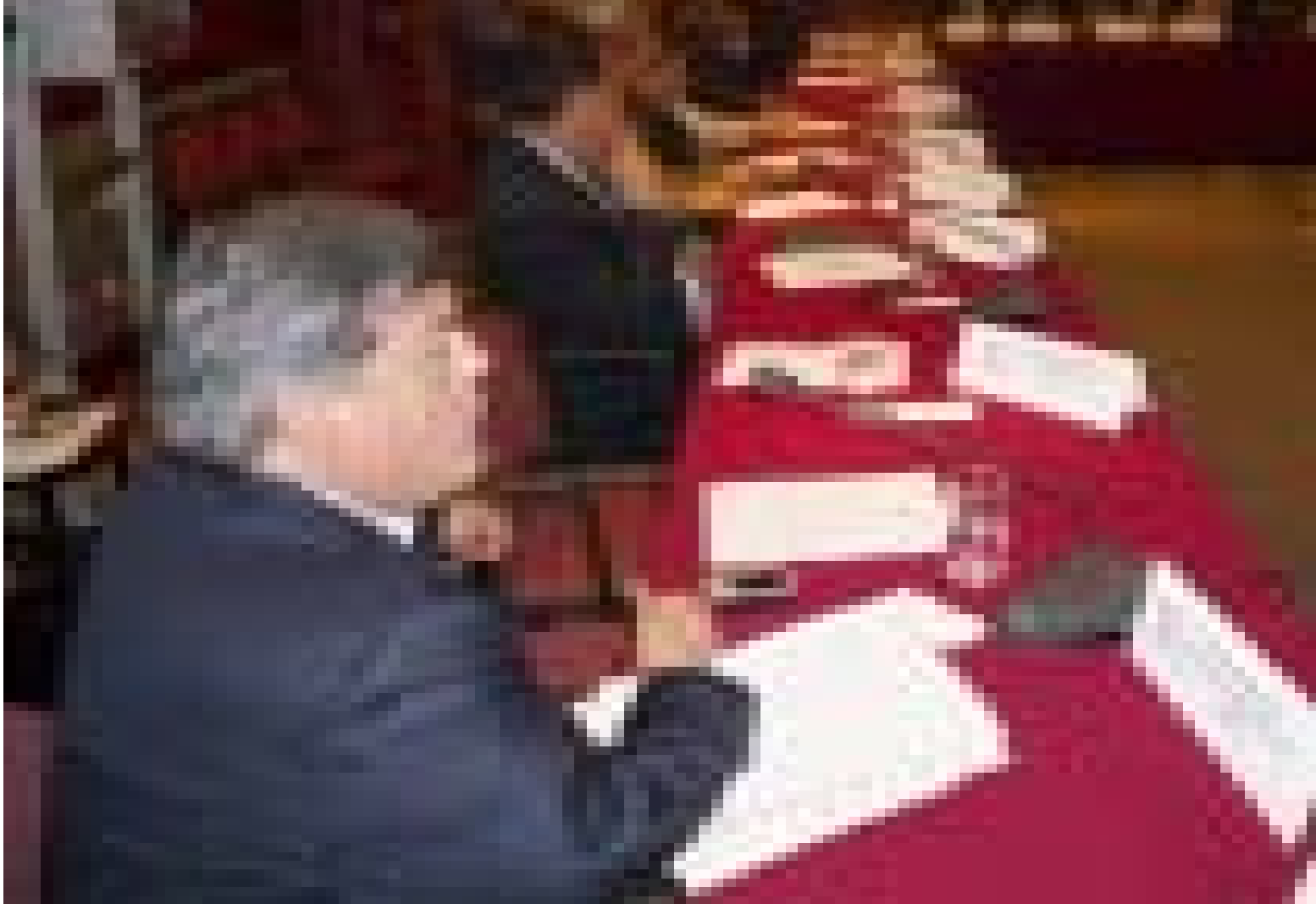
Presidente de la AMPE, César Acuña durante sesión del Acuerdo Nacional